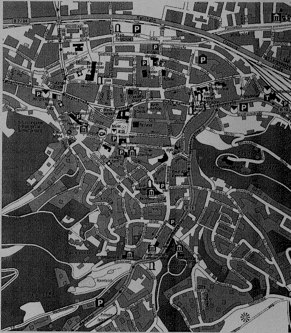
Ausschnitt des Innenstadtplanes von Eisenach

verändert nach: Eisenach entdecken und erleben. Ein Stadtrundgang. – Tourismus Eisenach GmbH